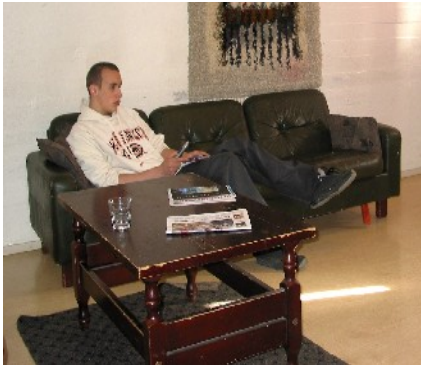
Koulutuskeskuksen poikien asuntolasta.

Mäntän seudun koulutuskeskuksella on Mäntässä kaksi asuntola, jotka on tarkoitettu ensisijaisesti nuorisoasteen ammatillisessa koulutuksessa oleville alle 18-vuotiaille opiskelijoille. Asuntolanhoitaja huolehtii yleisten tilojen siivouksesta ja liinavaatehuollosta. Lisäksi asuntolanhoitaja on paikalla sekä tyttöjen että poikien asuntolassa muutaman tunnin iltaisin (ma - to). Asunnoista peritään asuntolapalvelumaksua kaksi kertaa vuodessa. Asuntolat sijaitsevat kävelymatkan päässä koulutuskeskuksesta.