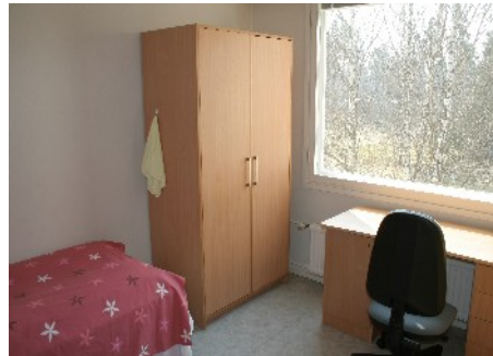
Koulutuskeskuksen tyttöjen asuntolasta.

Koulutuskeskuksen tyttöjen asuntola on osoitteessa Puistokatu 31, vuokratalon H-rapun kahdessa kerroksessa. Kummassakin kerroksessa on asuntolayksikkö, joka on tehty yhdistämällä kaksi tavallista vuokra-asuntoa.