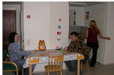
Valkaman opiskelija-asunnot ovat osittain kalustettuja.

Valkaman kaikissa huoneistoissa on peruskalustus, eli yleisvalaisimet, sänky, työpöytä ja työtuoli, sekä keittiössä ruokailuryhmä. Kaksiossa on kummallakin asukkaalla oma lukittava huone, keittiö ja kylpyhuone ovat yhteiskäytössä. Vuode- ja liinavaatteet sekä astiat on jokaisen tuotava itse. Koska huoneistot ovat valmiiksi kalustettuja, omia kalusteita voi tuoda vain täydennykseksi. Huoneistossa olevia kalusteita ei saa viedä sieltä pois.