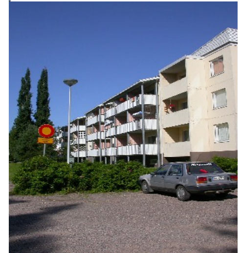
Vuokratalo Puistokatu 31.

JÄTÄ LEMMIKKISI KOTIIN OPISKELUN AJAKSI!