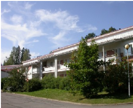
Opiskelijatalo Valkama, Koulukatu 6.

Aivan koulukeskuksen vieressä Mäntässä on 54-paikkainen opiskelijatalo Valkama. Etusijalla asumaan ovat täysi-ikäiset ammattikorkeakoulu-opiskelijat. Kahdessa rakennuksessa sijaitsevan opiskelijatalon omistaa kaupungin omistama Koskelantalo Oy. Talossa on 16 huoneen ja tupakeittiön yksiotä, vuokra 348,29 – 429,68 €/kk riippuen yksiotä nelimäärästä. Kaupungin tuen ansiosta ammattikorkeakouluopiskelijoiden vuokra yksiotä on yllä mainittua vähän alhaisempi. Kaksioissa olevia soluasuntoaikoja on 38, niissä vuokra on 256,19 €/kk/opiskelija. Vuokraan voivat kaikki hakea opintotuen asumislisää, jolloin omavastuu jää alle sadan euron.